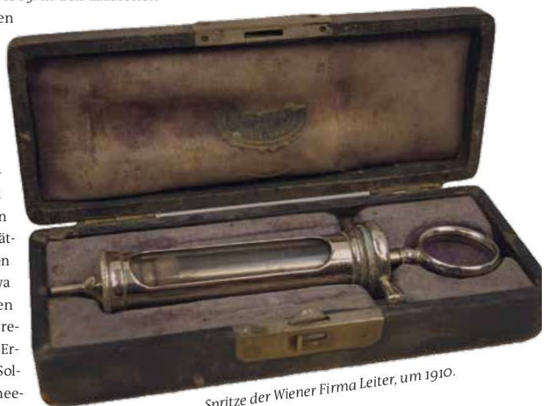
Spritze der Wiener Firma Leiter, um 1910.

Das Anlassobjekt für diesen Artikel ist eine um 1910 hergestellte Glasspritze der Wiener Firma „Leiter – Fabrik chirurgischer Instrumente und medicinischer Apparate“, welche dem Stil der Zeit in einem schönen Etui aufbewahrt wurde (Abb. 1). Diese Spritze konnte (wie die meisten Exemplare) für eine erfolgreiche Sterilisation auseinandergeschraubt werden und wurde also im Unterschied zu den heute verwendeten Plastikspritzen mehrmals verwendet. Erst ab der Mitte des 20. Jahrhunderts etablierte sich in der westlichen Medizin, regional unterschiedlich, die Verwendung von Einmal-Plastikspritzen.