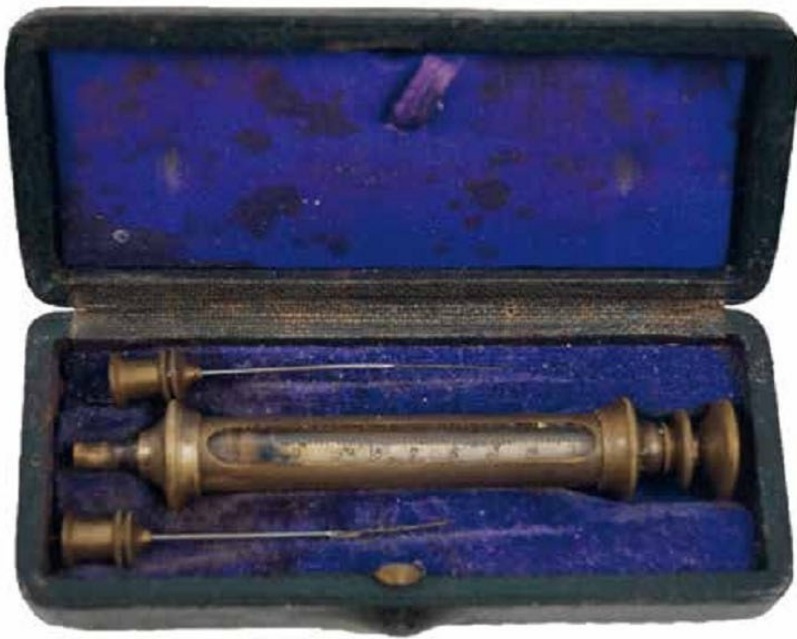
Spritze aus Glas und Metall in Etui aus Holz, außen Leder, innen violetter Samt, gefertigt um 1910, Maße 16x6x3 cm, medizinhistorische Sammlung des Freundeskreis Pesthaus, Inv.Nr. 3261.