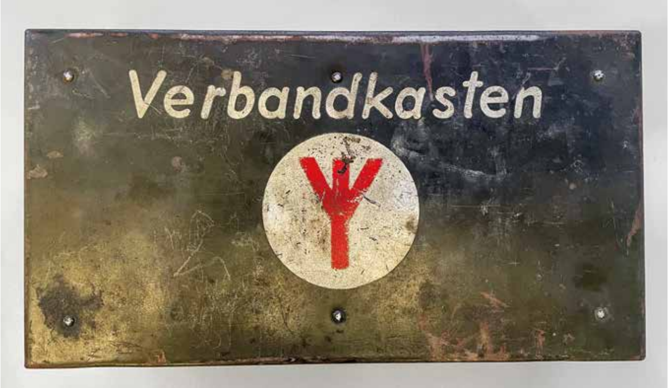
Abb. 1: Der Verbandkasten als Ganzes in der Vogelperspektive.