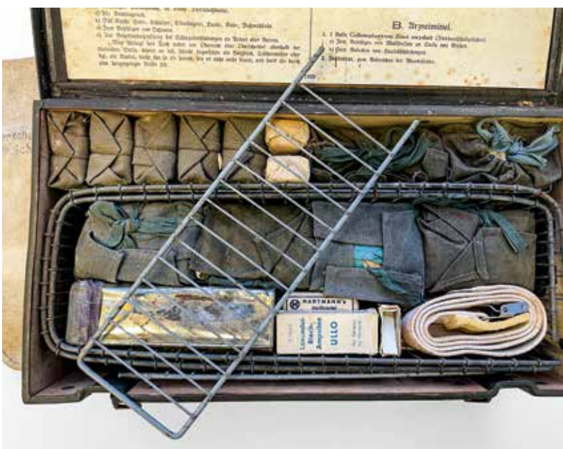
Abb. 3: Ein Teil des Inhalts, unter anderem die erwähnten Cramer-Schienen.