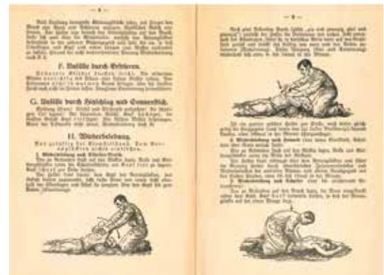
Abb. 4: Eindruck der damals empfohlenen Reanimationsmaßnahmen.

Hauptsächlich finden sich in diesem Erste-Hilfe-Kasten Verbandsmaterial und sogenannte Cramer-Schienen (siehe Abb. 3). 2 Der Namensgeber Friedrich Cramer wurde 1847 in Wiesbaden geboren und studierte Medizin in Marburg, Würzburg und Bonn (Promotion 1870). Er nahm anschließend als Feld-